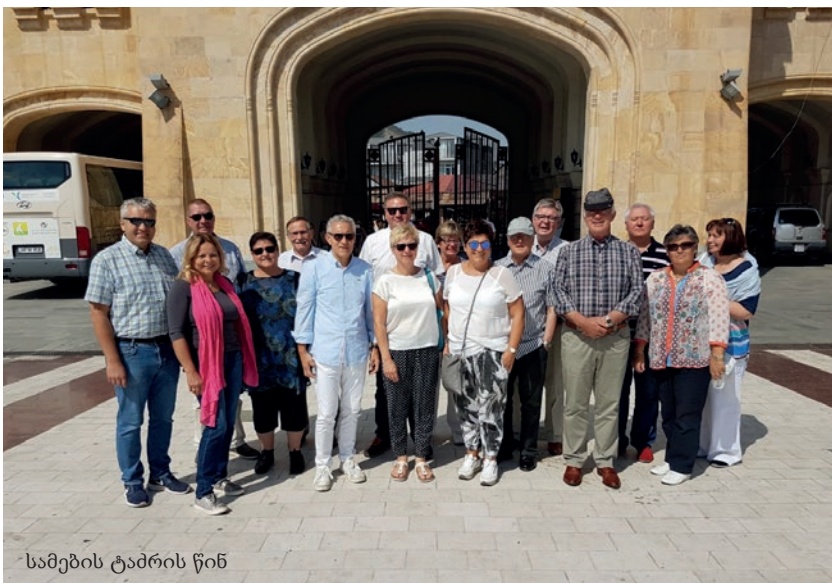
სამების ტაძრის წინ