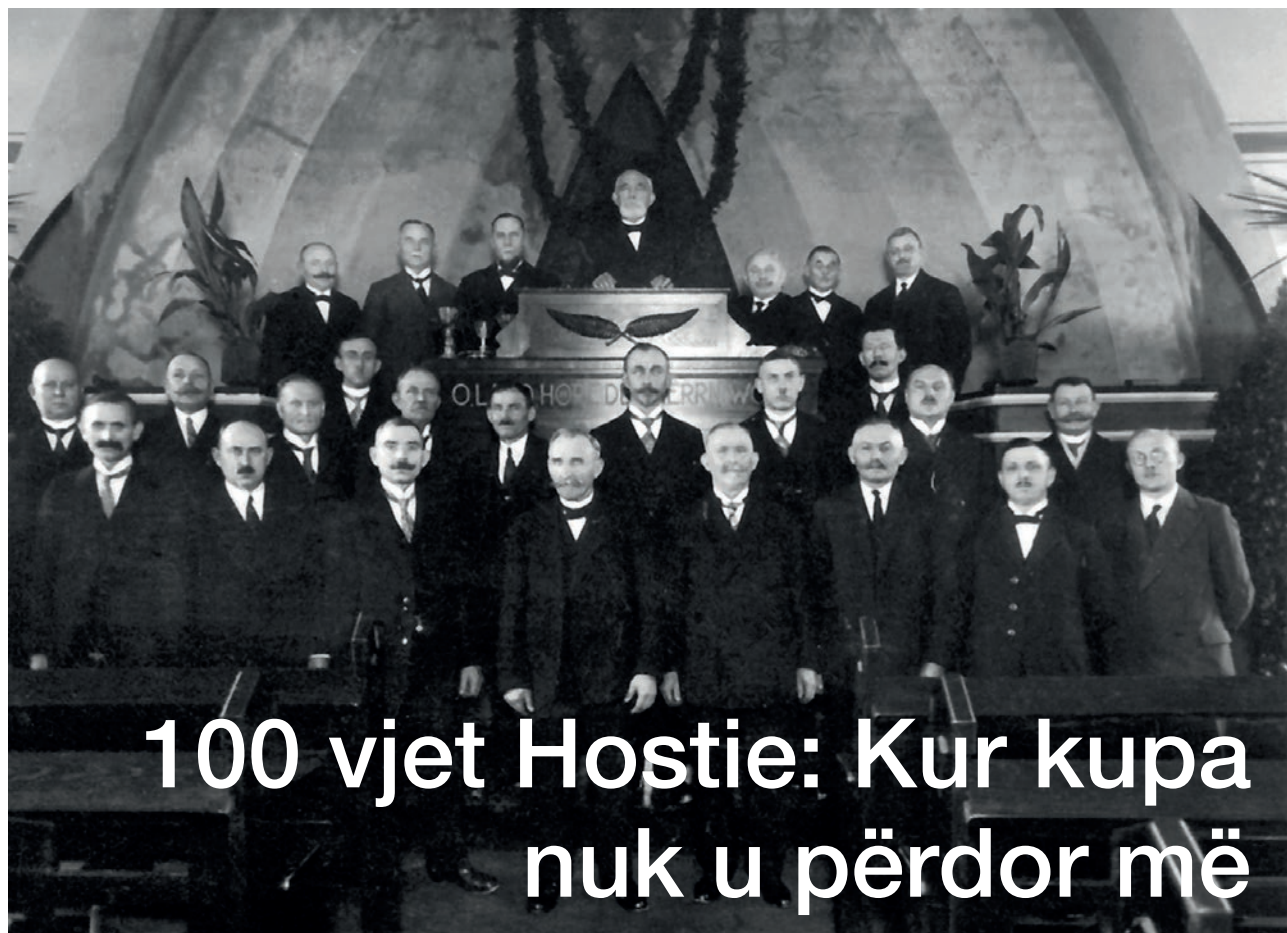
(Ushtarët në Illogore)