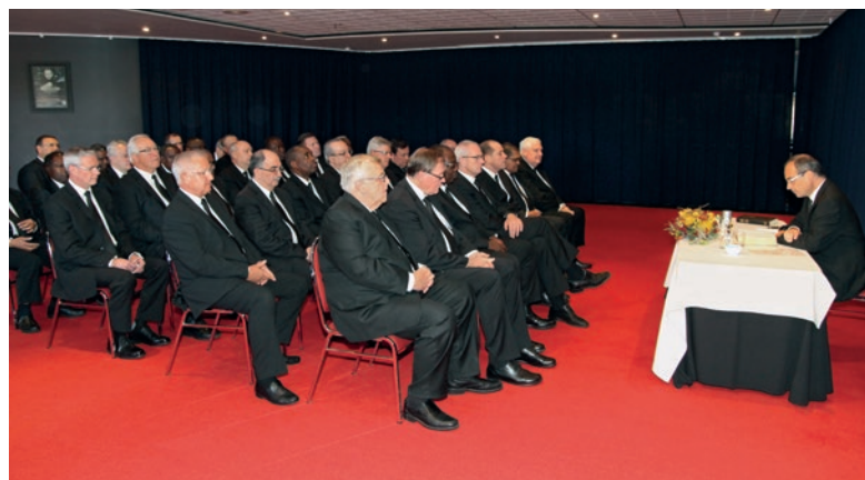
პირველმოციქულს თან ახლდნენ 17 სამხ. მოციქული და 7 სამხ. მოციქულის თანაშემწე. ერთი დღით მათ ადრე იგი მათთან ერთად საშემოდგომო შეკრებას დაესწრო.

ახლა კი ისმის კითხვა: რისი იმედი გვაქვს? რაზე ვლაპარაკობთ? როცა ვამბობთ, რაღაცის იმედი გვაქვსო, როგორც წესი, ამაში იმას ვგულისხმობთ, რომ რაღაცას ველოდებით და ვიმედოვნებთ, რომ ჩვენი მოლოდინი გამართლდება. ეს არის იმედის ჩვეულებრივი განსაზღვრება. მორწმუნეთა,