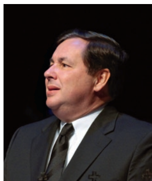
სამხ. მოციქული ლეონარდ-რიჰარდ კოლბი (აშშ)