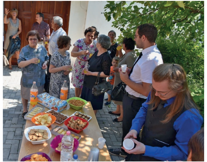
Brunch pas shërbesës fetare në Elbasan