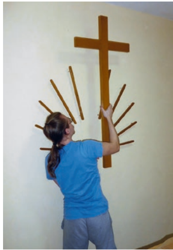
Emblema fiksohet përsëri në mur pas altarit