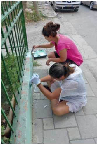
Bazamenti i murit merr një lyerje të re