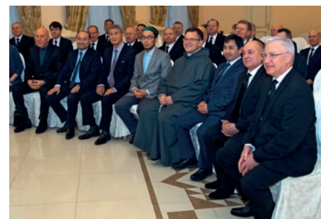
ოფიციალური მიღება მშვიდობიანი რელიგიური დიალოგისათვის ხელშეწყობის მიზნით: ღვთისმსახურების შემდეგ პირველმოციქული ჟან-ლუკ შნაიდერი სახელმწიფო ორგანოების, სხვა ეკლესიებისა და ისლამის წარმომადგენლებს შეხვდა.

საქმეებია“, განმარტა პირველმოციქულმა: „მოდით, მარტო ჩვენს საქმეებს ნუ განვწმინდავთ, არამედ ჩვენი აზრებიც გავეწმინდოთ. მოდით, დაფარულიცოდებოთ და ვძლიოთ, რომლებიც არავინ იცის და რომლებსაც ვერავინ ხედავს. მაგრამ უფლისათვის ისინი ისევე მნიშვნელოვანია, როგორც სხვა დანარჩენი.“