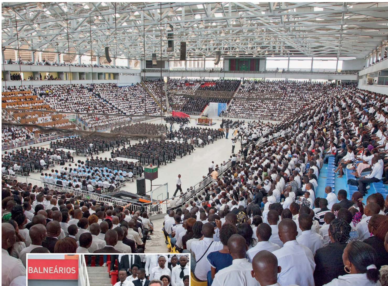
ფოტო: ჰერმან ბეიკე და ანგელის სტატისტიკა