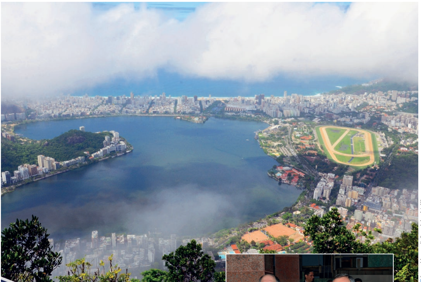
Լուսակարում՝ Բրազիլիայի ՆԱԵ

710 մ բարձրություն ունի այն լեռը, որի վրա Քրիստո Ռեդենթորը կանգնեցրել է Քրիստոսի արձանը և Ռիո դե Ժանեյրոյի վրա մի լավ հայացքի հնարավորություն ստեղծել: 2015-ի հոկտեմբերի 28-ի ժամերգությունը գլխավոր առաքյալ Շնայդերը տոնեց բրազիլական մեզապոլիսում: