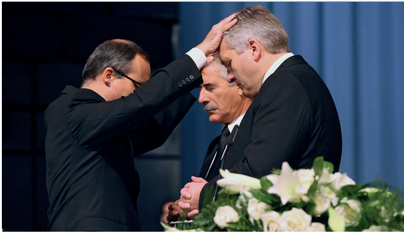
Լուսավորող՝ Ֆրանկ Շուլթեր

<< Արդ, մի խորհուրդ եմ հայտնում ձեզ. Բոլորս էլ