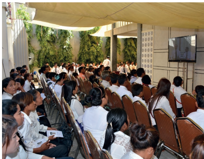
Լուսավորում՝ ՆԱՆ Կանադա

„ Հիսուսի կողմից ուղարկված առաքյալները գործի անցան: Շուտով նրանք կրոնական վերնախավի դիմադրությանը հանդիպեցին>>,- ամփոփեց Շնայդերը 2000 տարի առաջ կատարվածը: Առաքյալները ճնշումներին չէին ենթարկվում: Նրանք խնդրում էին համայնքներին՝ աջակցելու իրենց աշխատանքին: