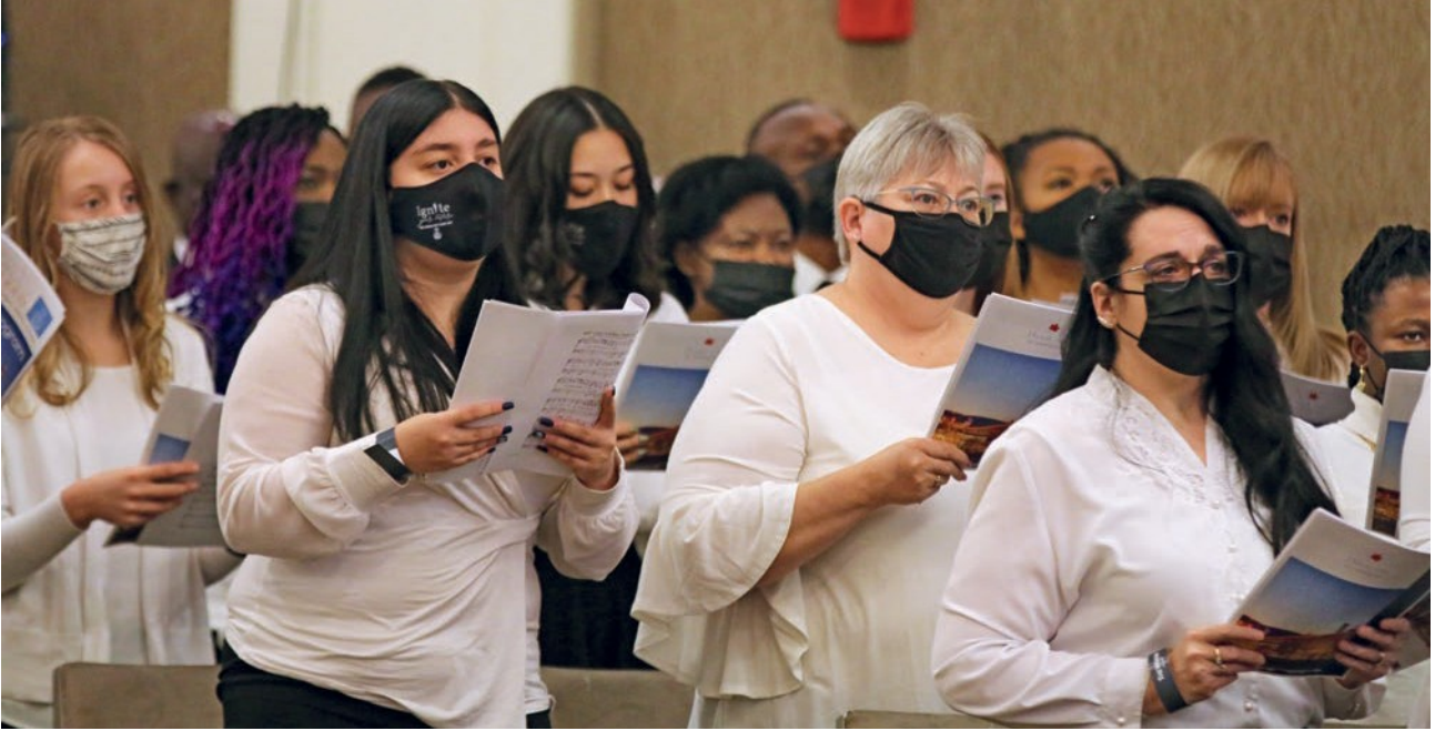
Ανάμεσα σε δύο παρεμβάσεις, μια χορωδία χαροποίησε τους συμμετέχοντες στην θεία λειτουργία

σώσει τους αμαρτωλούς! Ο Ιωάννης ο Βαπτιστής τον παρεξήγησε, όπως και οι μαθητές. Νόμιζαν ότι έπρεπε να τιμωρηθούν. Σκεφτείτε τον Πέτρο: Ήθελε να τιμωρήσει τον υπηρέτη του ιερατείου, που θέλησε να σταματήσει τον Ιησού, κόβοντας το αυτί του. Ο Ιησούς το απέρριψε αυτό (βλ. Λουκάς 22:49-51). Μια άλλη φορά, οι μαθητές θέλησαν να πέσει φωτιά από τον ουρανό, για να τιμωρηθούν οι αμαρτωλοί. Και σε αυτό επίσης, εναντιώθηκε ο Ιησούς (βλ. Λουκάς 9:51-56). Δεν ήλθε για να τιμωρήσει τους αμαρτωλούς, αλλά για να τους σώσει. Η διδασκαλία των Αποστόλων μας λέει ότι κανένας άνθρωπος δεν είναι απεσταλμένος από τον Ιησού Χριστό για να τιμωρήσει τους αμαρτωλούς, στο όνομά του. Κανείς δεν μπορεί να το δηλώσει αυτό, από μόνος του. Ο Ιησούς Χριστός είναι ο Σωτήρας. Σίγουρα η κοινωνία οφείλει να θεσπίζει κανόνες και να τιμωρεί τους εγκληματίες. Ο Ιησούς δεν το αντέκρουσε αυτό. Σεβόταν τους κοινωνικούς κανόνες της εποχής του. Ωστόσο, κανείς δεν μπορεί να τιμωρηθεί στο όνομα και κατ' εντολή του Ιησού Χριστού. Αυτό είναι κάτι που δεν ανταποκρίνεται στη διδασκαλία του.