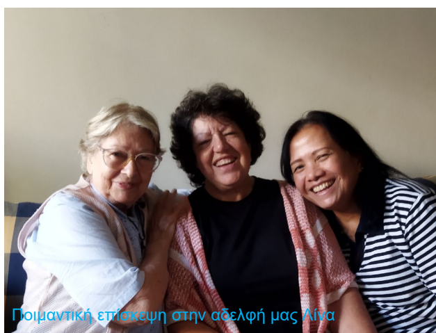
Ποιμαντική επίσκεψη στην αδελφή μας Αίνα

Για τον λόγο αυτό, τουλάχιστον μια φορά τον μήνα πραγματοποιούνται ποιμαντικές επισκέψεις σε αυτούς τους αδελφούς και τις αδελφές μας, για να υπάρχει η επαφή μεταξύ μας, αλλά και για να μη στερούνται τη συγχώρηση των αμαρτιών και τη συμμετοχή τους στην Αγία Κοινωνία. Ο επουράνιος Πατέρας μας φροντίζει όλα του τα παιδιά με τον καλύτερο τρόπο, επειδή δεν θέλει κανείς να είναι στο περιθώριο. Πάντοτε μας δίνει πολύ περισσότερα από αυτά που θα μπορούσαμε να περιμένουμε από αυτόν. Μπορεί το έργο του Κυρίου στην χώρα μας να είναι περιορισμένο σε σύγκριση με άλλες χώρες, παρ' όλα αυτά κανείς δεν είναι παραμελημένος. Και πάντοτε μας επιφυλάσσει εκπλήξεις που σκοπό έχουν την ενδυνάμωση της πίστης μας και την πληρέστερη χάρη και ευλογία για τον καθένα ξεχωριστά και για όλους μαζί. Ας είναι ευλογημένο το όνομά του.