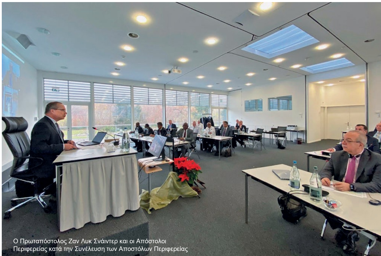
Ο Πρωταπόστολος Ζαν Λυκ Σνάιντερ και οι Απόστολοι Περιφέρειας κατά την Συνέλευση των Αποστόλων Περιφέρειας

Η φθινοπωρινή σύνοδος της Συνέλευσης των Αποστόλων Περιφέρειας ολοκληρώθηκε. Τα πιο αξιοσημείωτα θέματα ήταν ο ορισμός του αξιώματος, ερωτήματα σχετικά με τους συντάκτες της Αγίας Γραφής και οι νέες κατευθύνσεις για τους αδελφούς υπηρεσίας.