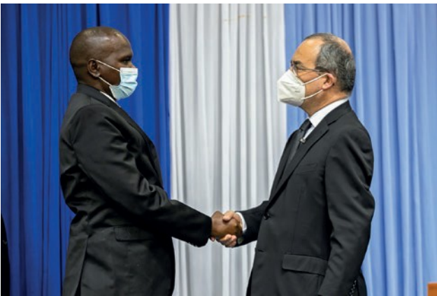
Μετά τη συνταξιοδότηση του Αποστόλου Τζόνθαν Μουτουά (Jonathan Mutua) ο επίσκοπος Φίλιπ Μουτία Μπία (Philip Mutia Mbia) χειροτονήθηκε ως νέος Απόστολος

Το να ζούμε για τον Χριστό περιλαμβάνει δύο πτυχές, εξήγησε ο Πρωταπόστολος: «Όποιος πιστεύει πραγματικά στον Ιησού Χριστό και τον εμπιστεύεται, έχει αυτή την έντονη επιθυμία να είναι κοντά στον Χριστό, στην αιωνιότητα. Και αυτό γίνεται ο στόχος, το νόημα της ζωής του». Και: «Όποιος πιστεύει πραγματικά στον Ιησού Χριστό, τον αγαπά και ξέρει ότι έχει κληθεί για να τον υπηρετήσει: «Με απέστειλε για να βοηθήσω τους άλλους να βιώσουν την εμπειρία της αγάπης του Θεού, διαμέσου των λόγων και των πράξεών μου»».