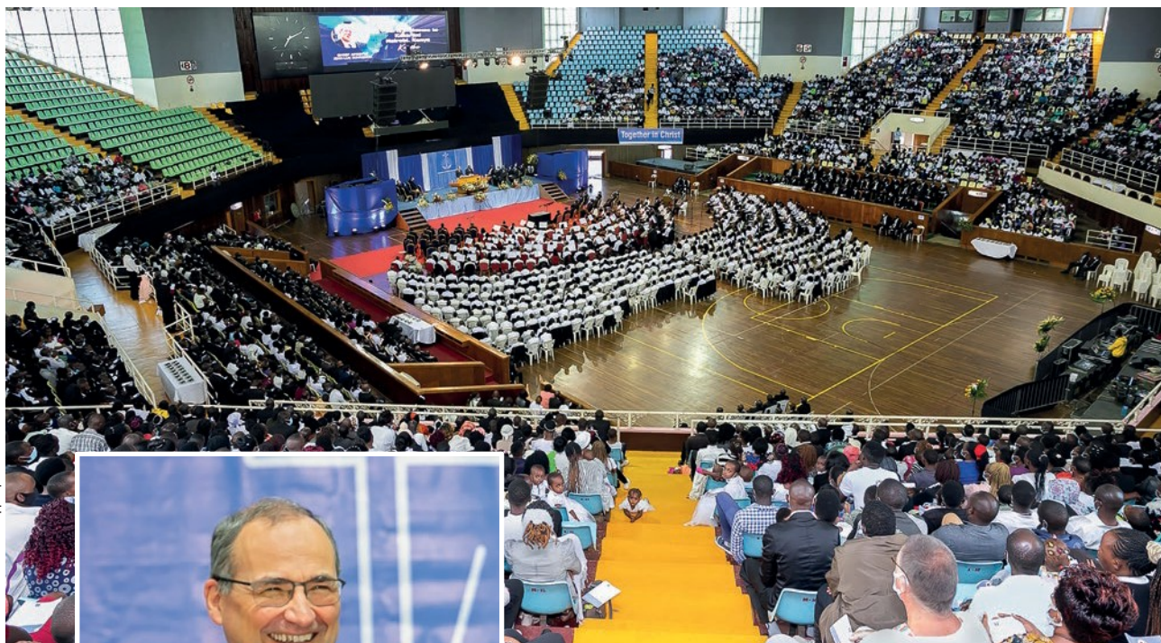
Περισσότεροι από 3 000 αδελφοί και αδελφές συμμετείχαν στην θεία λειτουργία στο Ναϊρόμπι (Κένυα)

Χριστού. Συνοψίζω: Για να ζήσουμε μαζί με τον Ιησού στην αιωνιότητα, οφείλουμε να ζούμε μαζί του σήμερα». Και αυτό σημαίνει: Ζούμε με τον Χριστό, ζούμε για τον Χριστό και ζούμε όπως ο Χριστός.