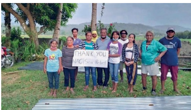
Οι πληγέντες στις Φιλιππίνες, δείχνουν την ευγνωμοσύνη τους στην «NAC SEA Relief»