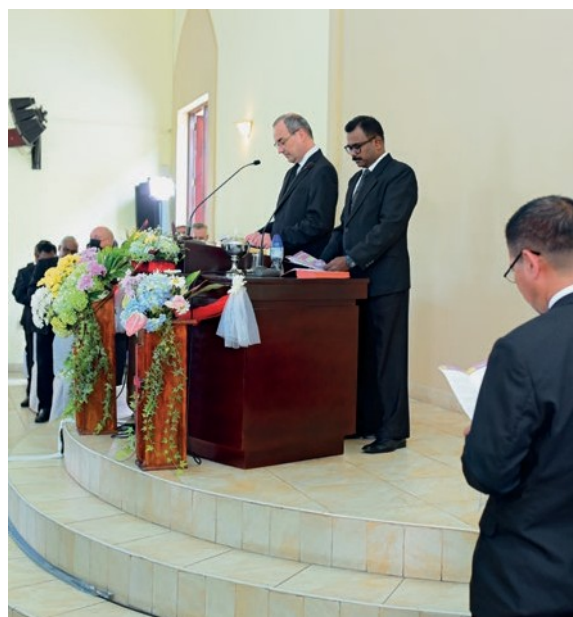
Φωτογραφίες: Ν.Ε. Σρι Λάνκα