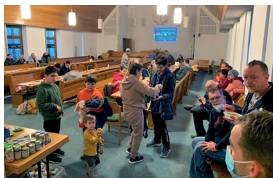
Αριστερά: Στην Πολωνία, φυγάδες περιμένουν τα λεωφορεία. Κάτω: η εκκλησία στο Μέρσεμπουργκ (Γερμανία) γίνεται καταφύγιο