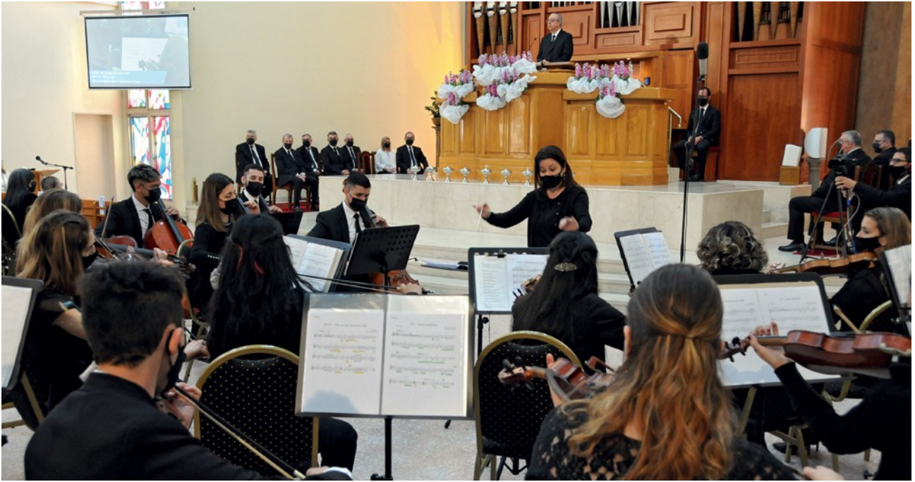
715 αδελφοί και αδελφές μπόρεσαν να συμμετάσχουν ζωντανά επί τόπου και 23 598 πιστοί σε 462 communautés, ήταν συνδεδεμένοι

Η ακόμη, όταν ο λαός του Ισραήλ όφειλε να κοιτάζει ψηλά σε ένα ορειχάλκινο φίδι, που ο Μωυσής έπρεπε να κατασκευάσει για να σωθεί ο λαός. «Η βοήθεια του Θεού δεν συνίστατο στο να απαλλάξει τον λαό από τα φίδια, αλλά στην θεραπεία όσων εμπιστευόνταν τον λόγο του. Ο Ιησούς εξήγησε ότι το ορειχάλκινο φίδι προμήνυε την θυσία του στο σταυρό». Ο Πρωταπόστολος έφτασε στο συμπέρασμα ότι, από την πτώση στην αμαρτία, το κακό εδραίωσε την κυριαρχία του επάνω στους ανθρώπους και τους κάνει να υποφέρουν, Και ο Θεός δεν παρεμβαίνει για να αλλάξει τον κόσμο. «Μας ζητεί να υψώνουμε τα μάτια προς τον Ιησού Χριστό. Εκείνος που πιστεύει στον Χριστό θα μπορεί να απελευθερωθεί από το κακό και να έχει πρόσβαση στην αιώνια ζωή».