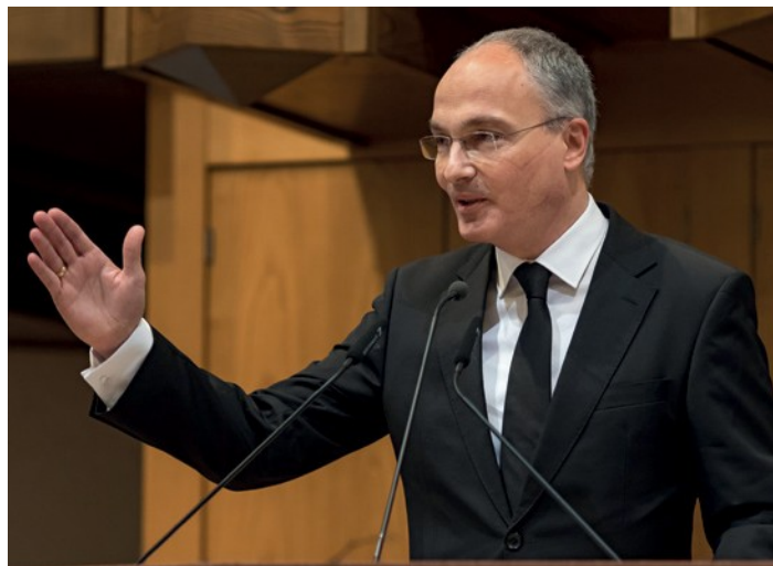
Κατά τη διάρκεια του κηρύγματος ο αναπληρωτής Απóstολος Περιφέρειας κλήθηκε να συμμετάσχει (επάνω)

Αγαπημένοι μου, κοινωνία σημαίνει επίσης να είμαστε διατεθειμένοι να δίνουμε στους άλλους, αλλά επίσης – και αυτό είναι πολύ σημαντικό – να είμαστε πρόθυμοι να λάβουμε κάτι από τους άλλους. Θα μπορούσε να πει κάποιος ότι είναι εύκολο να λάβει