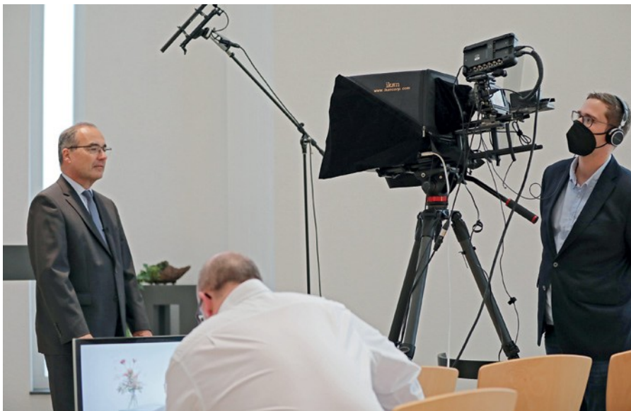
Ο Πρωταπόστολος Ζαν Λυκ Σνάιντερ, στο ετήσιο μήνυμά του μιλάει άπταιστα, Γαλλικά, Αγγλικά και Γερμανικά

θεί απεγνωσμένα να σταματήσει το κυλιόμενο κείμενο.