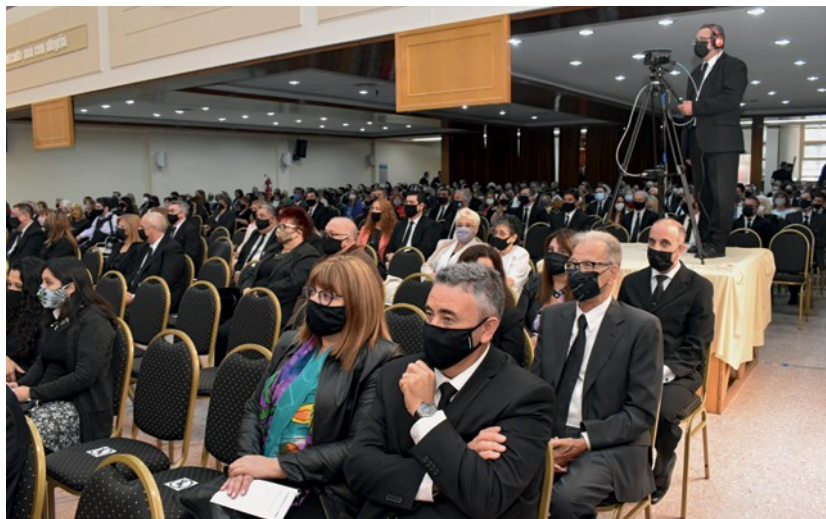
Φωτογραφίες Ν.Ε. Αργεντινή

Επιτέλους, μπορώ να ταξιδέψω ξανά στην Αργεντινή! Ο Πρωταπόστολος Ζαν Λυκ Σνάιντερ προσπάθησε αρκετές φορές να επισκεφτεί τις κοινότητες σε αυτή την χώρα της Νότιας Αμερικής. Δυστυχώς όλες απέτυχαν λόγω της επιμονής της πανδημίας του κορωνοϊού. Την Κυριακή 7 Νοεμβρίου 2021 ωστόσο, κατέστη τελικά δυνατό να τελέσει εκεί μια θεία λειτουργία.