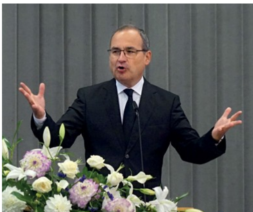
Ο Πρωταπίσκοπος Ζαν Λυκ Σβάνιτερ