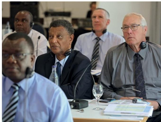
Οι αναπληρωτές Απόστολοι Περιφέρειας, οι Απόστολοι Περιφέρειας και ο Πρωταπόστολος στη Συνέλευση των Αποστόλων Περιφέρειας

το Νοέμβριο του 2020 και από τον Μάρτιο του 2021 δημοσίευσε ένα δογματικό κείμενο, με θέμα «Ο άνδρας και η γυναίκα κατ' εικόνα του Θεού». Παρακάτω είναι τα κυριότερα μηνύματα: