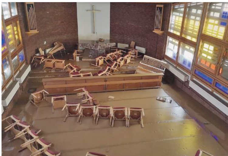
αριστερά: Η πλημμυρισμένη εκκλησία στο Σίνζιγκ (Γερμανία) κάτω: Η ανακατασκευασμένη εκκλησία στο Σαν Ισίδωρο (Φιλιππίνες)