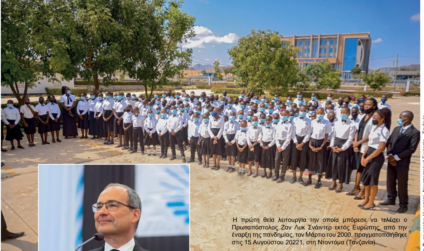
Η πρώτη θεία λειτουργία την οποία μπόρεσε να τελέσει ο Πρωταπóstολος Ζαν Λυκ Σνάιντερ εκτός Ευρώπης, από την έναρξη της πανδημίας, τον Μάρτιο του 2000, πραγματοποιήθηκε στις 15 Αυγούστου 20221, στη Ντοντόμα (Τανζανία).