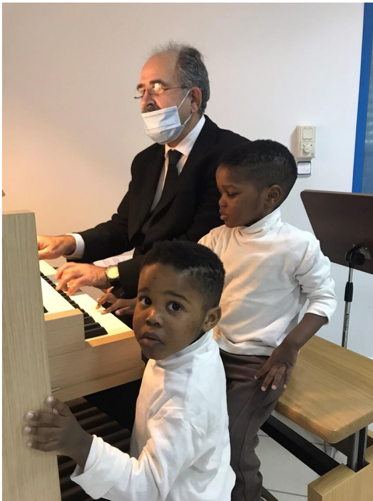
■ Φωτογραφία εξωφύλλου : Kevin Sargent