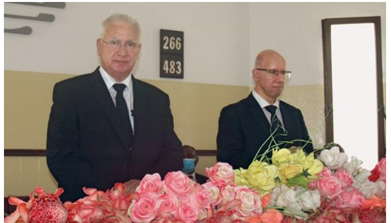
Στο Σάο Τομέ και Πρίνσιπε, ο Πρωταπόστολος τέλεσε δύο θείες λειτουργίες (αριστερά). Ο Απόστολος Περιφέρειας Βόλφγκανγκ Ναντόλνυ με τον μεταφραστή (επάνω)

Στις 12 Σεπτεμβρίου ο Πρωταπόστολος Ζαν Λυκ Σνάιντερ τέλεσε μια θεία λειτουργία στη Σαντάνα (Σάο Τομέ και Πρίνσιπε).