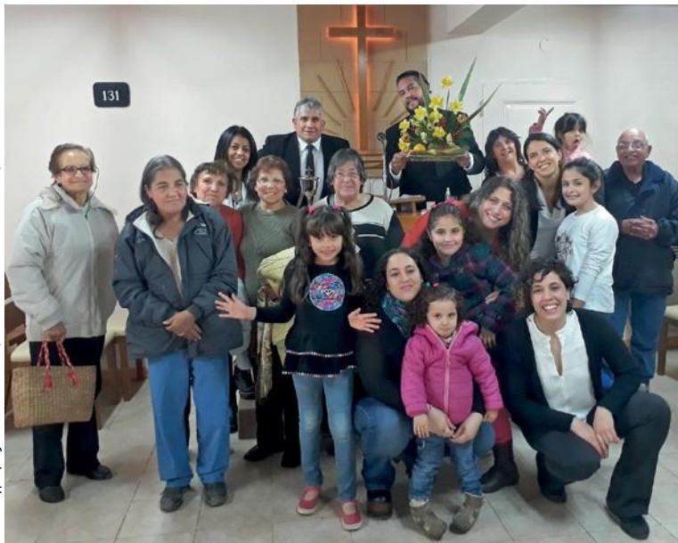
αριστερά: Η κοινότητα Ελ Μπολσόν droite: Η Κόνι (εμπρός) με τις νέες και τους νέους της Αργεντινής, κατά τη διάρκεια των Ημερών Νεολαίας