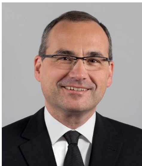
■ Φωτογραφία : Διεθνής Νεοαποστολική Εκκλησία

Το να ζούμε μαζί σε κοινωνία μας προετοιμάζει για την επιστροφή του Κυρίου. Επειδή, γι' αυτήν μεγαλώνουμε όλοι μαζί, για να γίνουμε η Εκκλησία Νυμφία και σε αυτή την κοινωνία μαθαίνουμε να ξεπερνάμε όλα όσα μας χωρίζουν. Ζούμε μαζί εν Χριστώ, σημαίνει : Δεσμευόμαστε να δίνουμε στον πλησίον και να λαμβάνουμε από αυτόν.