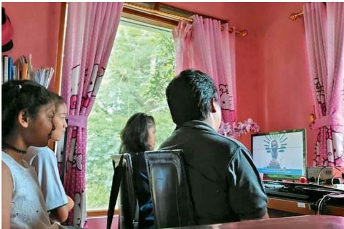
Συμμετοχή στην θεία λειτουργία, από το σαλόνι του σπιτιού

πήγαιναν από σπίτι σε σπίτι για να εορτάσουν μια σύντομη επαγρύπνηση και για να τελέσουν την Αγία Κοινωνία. Η εκκλησιαστική περιφέρεια που αριθμεί 1,8 εκατομμύρια μέλη, κάλεσε αξιώματα σε ημερία για ενίσχυση, ενεργοποιώντας ξανά το αξίωμά τους.