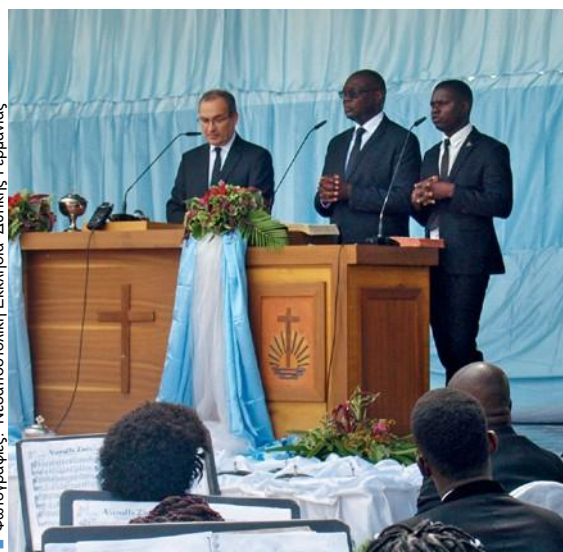
■ Φωτογραφίες: Νεοαποστολική Εκκλησία Δυτικής Γερμανίας

Κυριακή 12 Ιανουαρίου 2020: Η κοινότητα του Ντούντο, στην Βόρεια Αγκόλα, μπορούσε να ανασάνει, επειδή ο Πρωταπόστολος Ζαν Λυκ Σνάιντερ είχε έλθει για να εξηγήσει στους πιστούς το βαθύ νόημα της πίστης στον Θεό: «Ο Θεός μας απελευθέρωσε από το έργο του κακού, διαμέσου του έργου του Ιησού» – Αυτό ήταν το μήνυμά του.