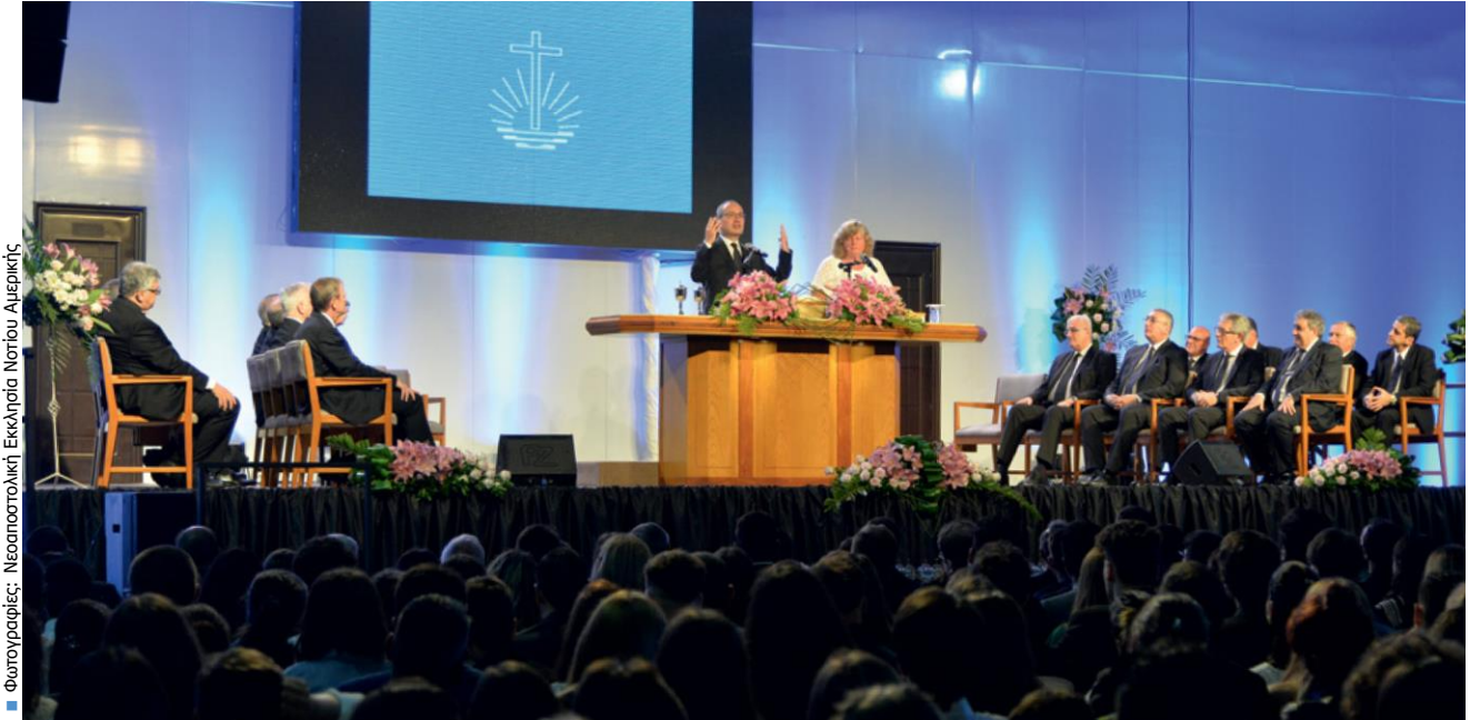
■ Φωτογραφίες: Νεοαποστολική Εκκλησία Νοτίου Αμερικής