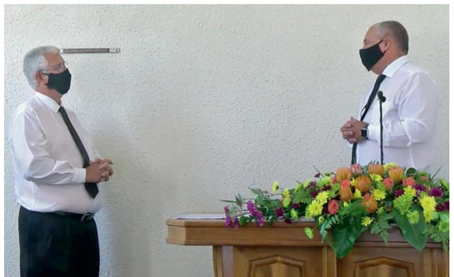
Επάνω: Ο Απόστολος Λαϊόνελ Μέγιερ Αριστερά: Οι Απόστολοι Τζόνναθαν Καρλ Στουρμ και Άρνολντ Μάρτιγκ

Στις 31 Δεκεμβρίου 2020, συνολικά 250.500 αδελφοί υπηρεσίας ήταν ενεργοί σε διακονικά και ιερατικά αξιώματα. Στο πλευρό των Αποστόλων υπηρετούν τους αδελφούς και τις αδελφές στην πίστη σε 57.800 κοινότητες σε όλο τον κόσμο. Τη στιγμή αυτή υπάρχουν σε ενεργή δραστηριότητα, 325 Απόστολοι, 7 αναπληρωτές Απόστολοι Περιφέρειας, 15 Απόστολοι Περιφέρειας και ένας Πρωταπόστολος.