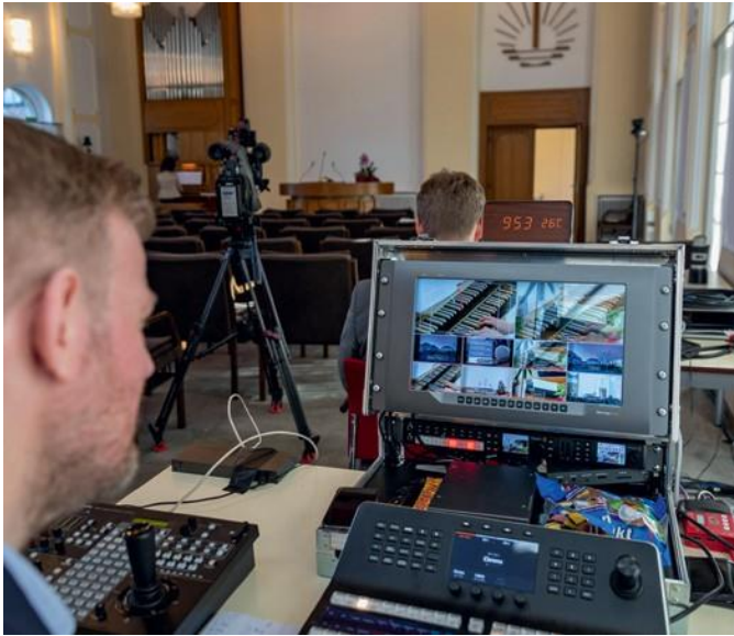
Αριστερά: Βιντεομετάδοση μιας θείας λειτουργίας. Κάτω: Μέλη χορωδίες βρίσκονται ξανά μεταξύ τους, για να ψάλλουν σε μια εικονική χορωδία.