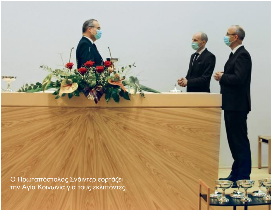
Ο Πρωταπόστολος Σνάιντερ εορτάζει την Αγία Κοινωνία για τους εκλιπόντες

τητα, την προσωπική άποψη, την προσωπική ευημερία και τα προσωπικά ενδιαφέροντα. Για ορισμένους, το «Εγώ» είναι τόσο μεγάλο που ο Ιησούς ξαφνικά, γίνεται όλο και πιο μικρός. Το «Εγώ» γίνεται τόσο μεγάλο που το «Εμείς» ξεχνιέται εντελώς. Αυτό με επηρεάζει με πολύ διαφορετικούς τρόπους και μου δίνει μια παύση για σκέψη.