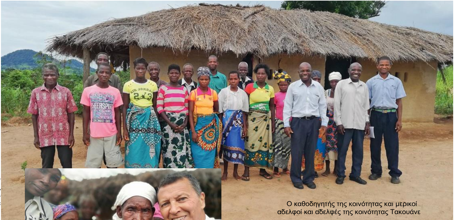
Ο καθοδηγητής της κοινότητας και μερικοί αδελφοί και αδελφές της κοινότητας Τακούανε

Ο Άλβιν Βίτεν και η σύζυγός του φτάνουν στην Μοζαμβίκη. Για αρκετούς μήνες διασχίζουν την χώρα. Επισκέπτονται εκατοντάδες κοινότητες, καθορίζουν γεωγραφικές συντεταγμένες, φωτογραφίζουν τους καθοδηγητές και τις εκκλησίες των διαφόρων κοινοτήτων. Ο κατάλογός τους περιλαμβάνει 1326 κοινότητες.