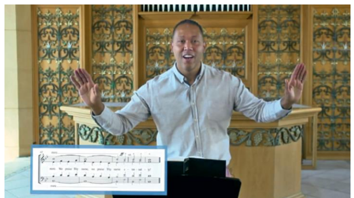
Εικονική πρόβα χορωδίας: Ο διευθυντής της χορωδίας βρίσκεται στην εκκλησία, τα μέλη είναι στα σπίτια τους.

αποφυγή των χειρότερων. Οι εθελοντές βρέθηκαν μπροστά σε εντελώς νέες προκλήσεις, που μπορούσαν να αντιμετωπιστούν μόνο με ασυνήθιστες ιδέες.