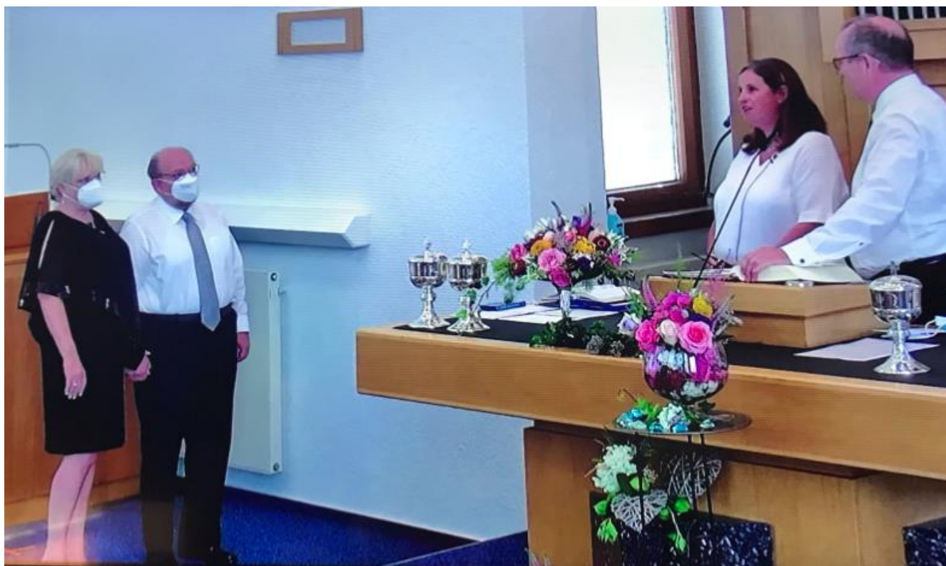
■ Φωτογραφία εξωφύλλου: Oliver Rütten (Φωτογραφία Αρχείου, η Διοίκηση της Εκκλησίας στη Ζυρίχη, 11.2018) ■ Φωτογραφία επάνω: Στιγμιότυπο από τον εορτασμό των 25 χρόνων γάμου, του επισκόπου μας Αράμ Φεστζιάν