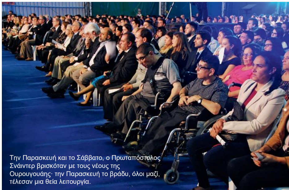
Την Παρασκευή και το Σάββατο, ο Πρωταπόστολος Σνάιντερ βρισκόταν με τους νέους της Ουρουγουάης· την Παρασκευή το βράδυ, όλοι μαζί, τέλεσαν μια θεία λειτουργία.

«Οφείλουμε να τηρούμε τις Εντολές, όπως τις τήρησε ο Ιησούς Χριστός», υπογράμμισε ο Πρωταπόστολος.