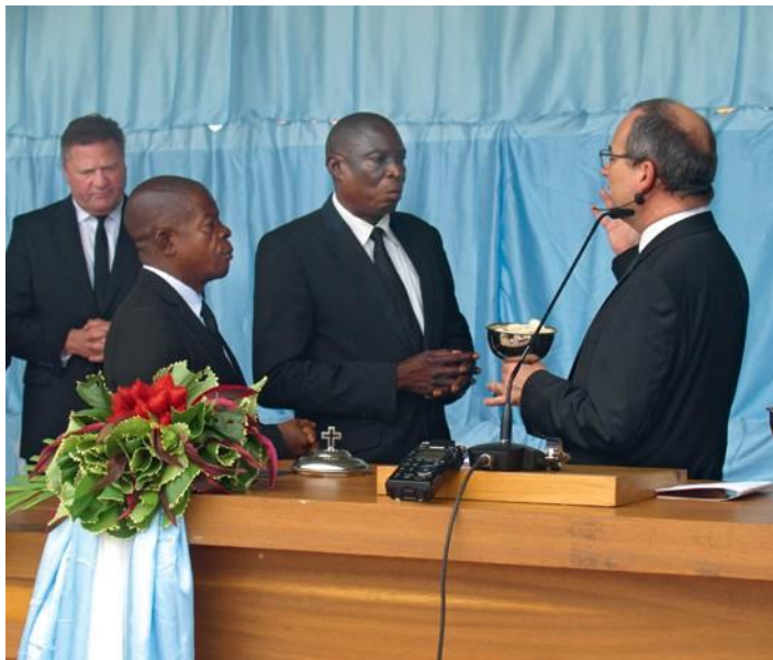
Ο Πρωταπόστολος εορτάζει την Αγία Κοινωνία για τους εκλιπόντες