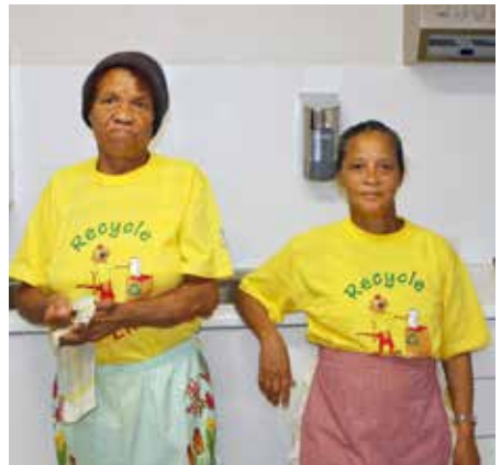
▲莉莉阿姨和凯西阿姨正在准备午餐