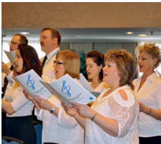
▲聚会实况向加拿大 100 多个教会会堂转播