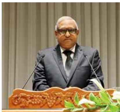
▲教区使徒助理大卫·德瓦瑞杰 (印度)