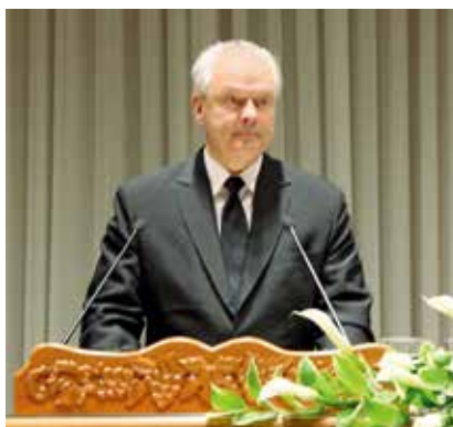
▲教区使徒助理约翰·索伯特卡 (加拿大)