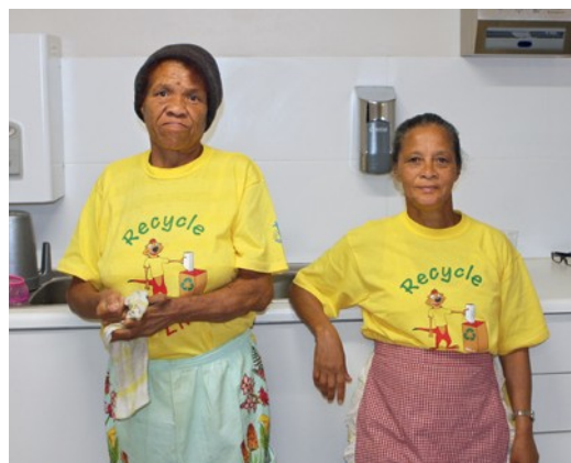
Υπάρχουν πολυάριθμοι εθελοντές: για τα καθήκοντα, τα γεύματα, τον αθλητισμό, και τις εορτές