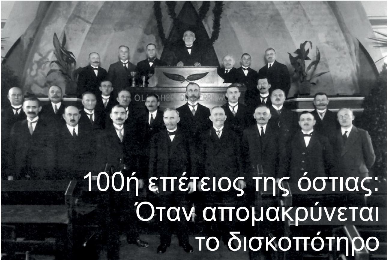
■ Φωτογραφία: Κεντρικά Αρχεία Ν.Ε. Βόρειος Ρηνανίας Βεστφαλίας και βυρσαρχίν. de / Φωτογραφία στην επόμενη σελίδα (στρατιώτες στην τάξη)