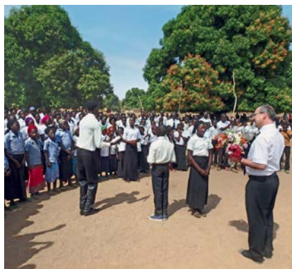
■ Φωτογραφία εξωφύλλου: Frank Schultdt ■ Φωτογραφία Πρωταποστόλου: Ν.Ε. Καναδά