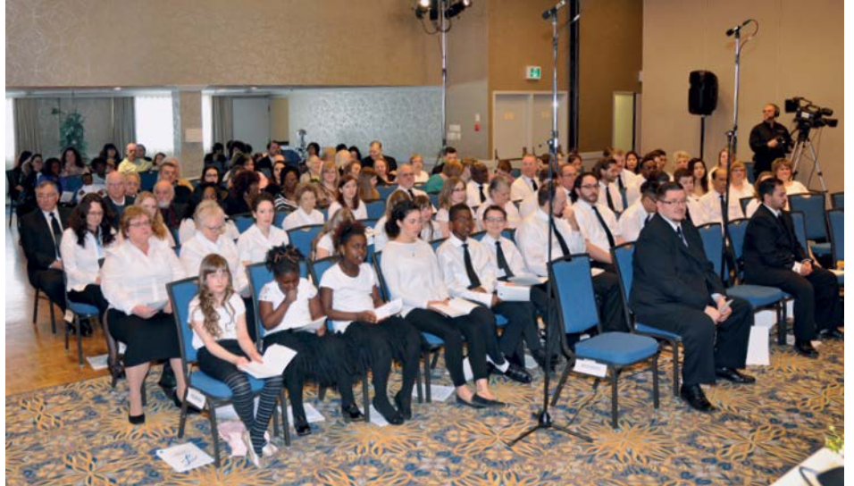
■ Φωτογραφία: Ν.Ε. Καναδά