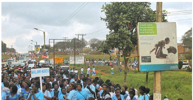
Τις βλέπουμε επίσης καθ' οδόν, στο Μαλάουι, στη συνάντηση των γυναικών

Οι δραστηριότητες αυτές ακολουθούν δύο στόχους στον τομέα των οικονομικών: από την μία πλευρά την ενίσχυση της οικονομικής ανάπτυξης των γυναικών και από την άλλη, την υποστήριξη του έργου της Εκκλησίας. Έτσι οι πράξεις συγκέντρωσης δωρεών αποτελούν επίσης μέρος των δραστηριοτήτων τους. Έτσι, μόνο κατά τη διεθνή συνάντηση των γυναικών στο Μζούζου μπόρεσε να συγκεντρωθεί το ισότιμο 50000 δολαρίων Αμερικής. Πριν απ' όλα τα χρήματα αυτά, επενδύονται σε φιλανθρωπικά προγράμματα – όπως η οικονομική στήριξη της μητρότητας ή ενός σχολείου – αλλά επίσης και στην κατασκευή εκκλησιών της Νεοαποστολικής κοινότητας. Ο Απόστολος Περιφέρειας Τσαρλς Νταντούλα τονίζει τη σημασία αυτού του ποσού, κατά την διάρκεια των τελευταίων δεκαετιών: «Οι γυναίκες παίζουν ένα καθοριστικό ρόλο στην ανάπτυξη της Εκκλησίας.»