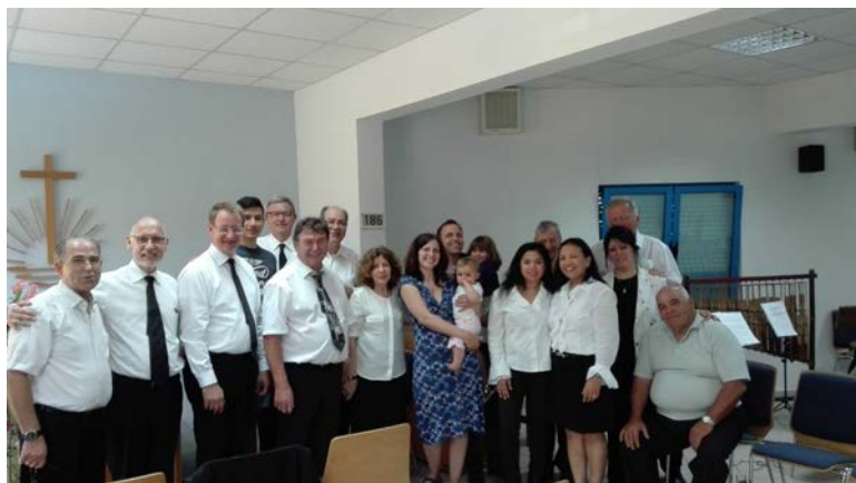
Η καθιερωμένη αναμνηστική φωτογραφία