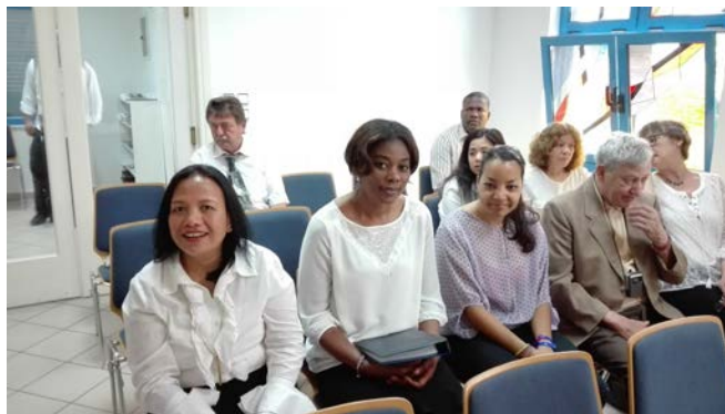
Πριν την έναρξη της θείας λειτουργίας

Με μεγάλη λοιπόν χαρά και απαλλαγμένοι από κάθε βάρος και έγνοια, συμμετείχαμε όλοι στην θεία λειτουργία του Αποστόλου μας, ο οποίος μας υπηρέτησε με τον λόγο από τον Μάρκο 10:31: «Πολλοί, όμως, πρώτοι θα είναι τελευταίοι, και οι τελευταίοι πρώτοι»