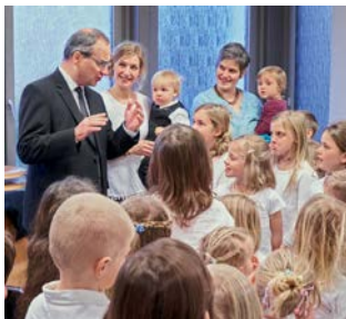
■ Φωτογραφία εξωφύλλου: Jessica Krämer ■ Φωτογραφία Πρωταποστόλου στο οπισθόφυλλο: Jona