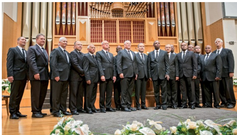
Ο Πρωταπóstολος μαζί με τους Αποστόλους της νέας Εκκλησιαστικής περιφέρειας της Νότιας Αφρικής