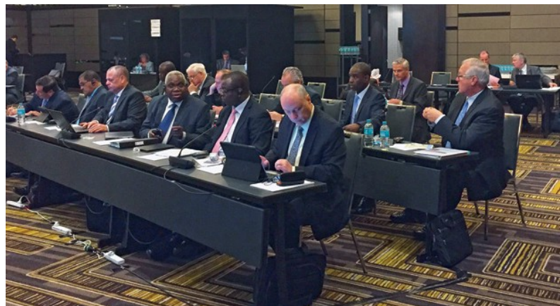
Συνέλευση των Αποστόλων Περιφερείας στο Περθ (Αυστραλία), Οκτώβριος 2016