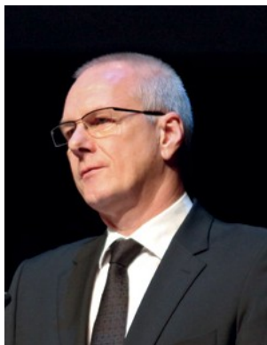
Ο Απóstολος Περιφέρειας Μάικλ Έριχ (Γερμανία)