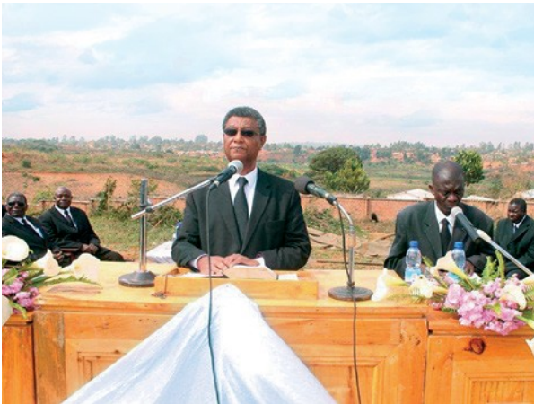
Ο αναπληρωτής Απόστολος Περιφέρειας Άρνολντ Μάνγκο, τέλεσε την θεία λειτουργία για το κλείσιμο των εκδηλώσεων