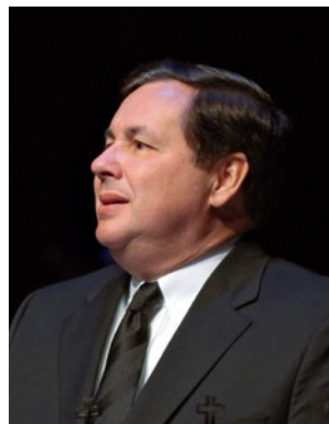
Ο Απóstολος Περιφέρειας Ρίχαρντ Κολμπ (Η.Π.Α.)